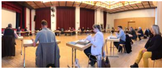
Um den vorgeschriebenen Abstand der Teilnehmer zu wahren, fand die konstituierende Sitzung des neuen Gemeinderats Anfang Mai in der Friesenhalle statt.

Liebe Leserinnen und Leser, das Corona-Virus brachte die Welt aus ihrem gewohnten Rhythmus: Vieles geht zur Zeit nicht oder nur eingeschränkt, die Terminkalender sind weitgehend leer, Versammlungen finden, wenn überhaupt, unter Sicherheitsvorkehrungen statt, meistens ersatzweise virtuell.