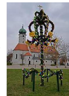
Archivbild der Osterkrone

Die Osterkrone, jedes Jahr beliebtes Fotomotiv auf dem Rathausplatz, konnte wegen der Coronakrise nicht gebunden und aufgestellt werden. Ebenfalls musste das Maifest im Evangelischen Pflegezentrum, bei dem die Damen der Frauen-Union die Bewohner/-innen jedes Jahr mit feinen Kuchen und einer Maibowle verwöhnen, ausfallen. Dafür sorgten wir mit Blumen und schriftlichen Ostergrüßen an die Mitarbeiter/-innen und Bewohner/-innen für eine kleine Freude auf den Stationen.